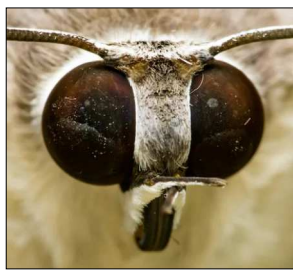
反射防止！「モスアイ型フィルム」

ディスプレイサーチのマジックベンチに座ると、横には誰もいないのに、前のスクリーンには、いそいそとやってきたアニメキャラ。貴方にもよって出てきます。リアルなサウンドと3D画像で、アニメの世界に飛び込みませんか？