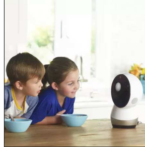
友達になれるロボット「ジーボ」

人気が出始めた家庭用ロボットですが、「ジーボ」は一味違います。大きな顔のアイコンで感情を表現し、まるで手があるみたいに動きながら話します。なにより人間そのものなのは、「ジーボ」と声をかければ、どんなに遠くてもこっちを向いて笑い、踊りだすんです。