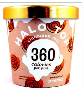
夢のアイスクリーム「Halo Top」

重度の視覚障害者にとって歩行は勇気のいることです。杖や盲導犬の助けがあっても、「見える」わけではありません。eサイト3を使えば「見える」のです。$9,995と高価ですが、現在千人以上の患者さんが使用しています。