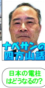
日本の電柱はどうなるの？

日中スマホの画面が見づらくて困ったことはありませんか？夜でもよく見える蛾の目の特殊な構造を応用したモスアイ型反射防止フィルムで、晴れた日の可視性は10倍、直射日光下の可視性も5倍に！でも歩きスマホは危険ですから、やめましょう！