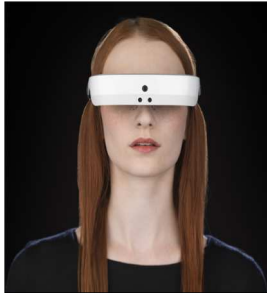
視覚障害者に光を！「eサイト3」

人気が出始めた家庭用ロボットですが、「ジーボ」は一味違います。大きな顔のアイコンで感情を表現し、まるで手があるみたいに動きながら話します。なにより人間そのものなのは、「ジーボ」と声をかければ、どんなに遠くてもこっちを向いて笑い、踊りだすんです。