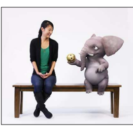
アニメキャラと遊べる「マジックベンチ」

500ccのカップにたっぷり入った濃厚な低糖アイススクリームが360カロリー以下なんて信じられない？「ハロートップ」アイススクリームはダイエット中に食べても大丈夫です。年間売り上げは昨年の25倍を達成。米国ではハーゲンダッツを追い越しました。