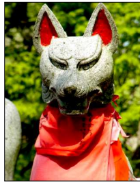
晴れ男・晴れ女＝稲荷系

八百万(やおよろず)の神が存在する国日本。人は神(＝霊)と共に生きていて、晴れ女や雨女と呼ばれる人に宿った霊が行く先々の天気を決めているのです(?!)