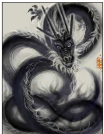
雨男・雨女＝龍神系

稲荷系の人は、楽観的で、好奇心旺盛です。色々なことに手を出しますが、勤勉で器用なので、始めるとすんなり習得し、また新しいものに目移りします。稲荷系の女性には美女が多いとされ、気配りも上手です。しかし、イタズラや悪のりが好きで、おちよこちよいのお調子者です。稲荷系の人は直感やひらめきを受け取るのが上手です。もし直感やインスピレーションが浮かんだら、直感を信じて行動してみると良い方向に進みます。