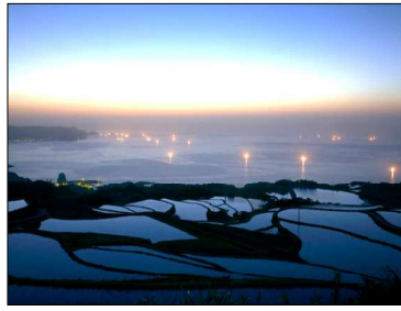
海外情報の玄関、向津具(むつなつこうの国)半島の棚田(山口県)ミライノシテン