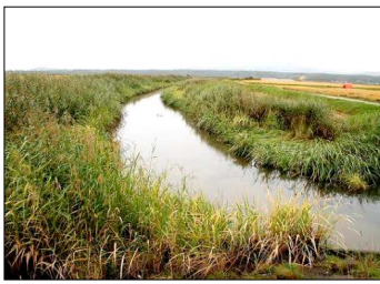
下流の十三湖の水位が上がると上流に逆流する「馬鹿川」(青森県)