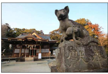
娘に化けた狐が命の恩人と夫婦になったという伝説の「女化(おなげ)町」(茨城県)産経ニュース