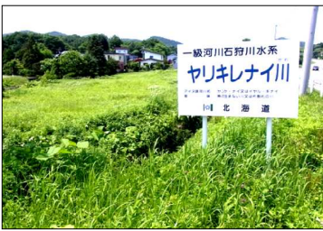
アイヌ語の「魚の住まない川」「ヤンケ・ナイ」から(北海道) NAVERまとめより