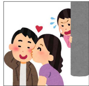
湿気が常に浮いている沼地だった浮気(ふけ)町(滋賀県)日本の地名.com