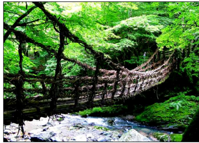
「大股で歩くと危険+小股で歩いても危険」な大歩危小歩危(おおほけこほけ)(徳島県) 阿波ナビ